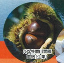
えな笠置山栗園 直送(生栗)