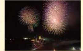
湖上の花火大会 7月