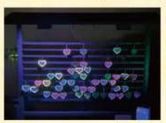
絵馬掛け/にぎわい広場