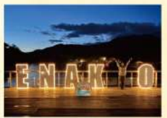
ウッドデッキ広場