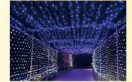
イルミネーション 12月～2月