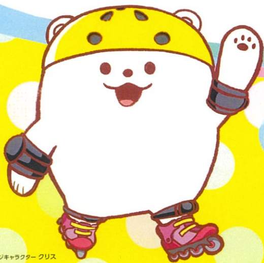
イメージキャラクター クリス