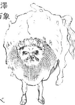
ツアーガイドハクタク

本展のツアーガイドを務める白澤(ハクタク)は、人語を解し、森羅万象に通ずる神獣です。『旅行用心集』では、牛のような体に、人面のような容貌と複数の角を有する姿で描かれています。著者の八隅蘆庵は、この白澤の図を懐に入れておけば、あらゆる災厄や病気を免れ、幸運を招くなどあまたのご利益があるため、旅中は最も敬うべきであると解説しています。