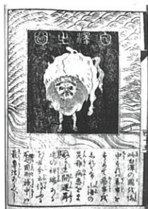
八隅蘆庵『旅行用心集全』(部分) (田中コレクション)