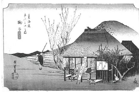
歌川広重「東海道五拾三次之内 鞠子 名物茶店」