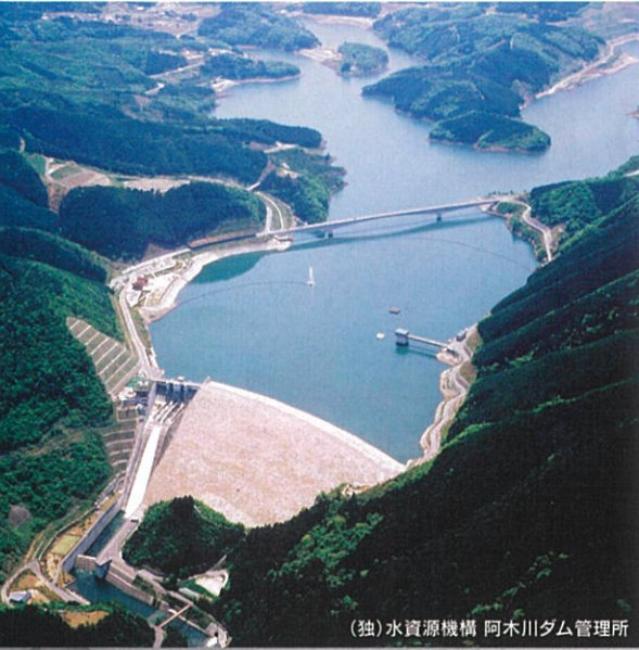
(独)水資源機構 阿木川ダム管理所