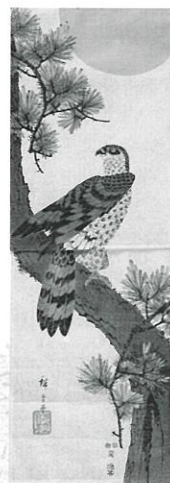
上: 歌川広重「不二三十六景 東都江戸橋日本橋」当館蔵 下左: 歌川広重「富士三十六景 駿河三保松原」当館蔵 下右: 歌川広重「松に鷹」当館蔵(田中コレクション)